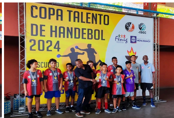
VICE-CAMPEÃO - NIHC