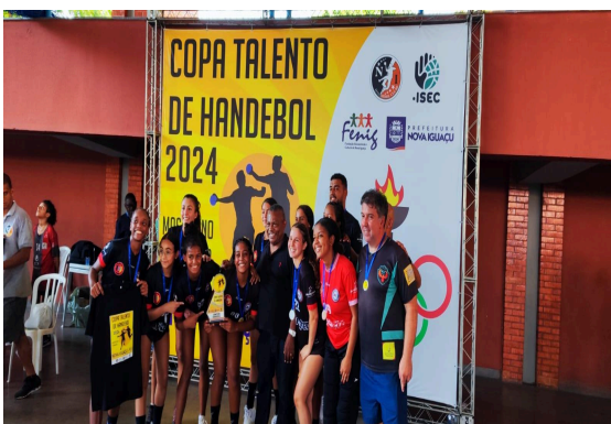
CAMPEÃO - CHAC/ NIHC