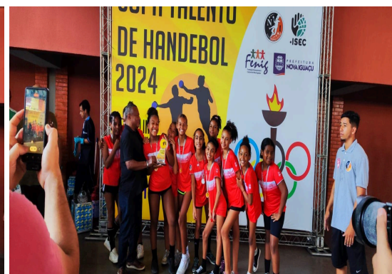
VICE-CAMPEÃO - CEAS A