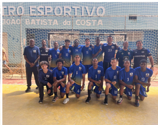
Mesquita SEMCELT A