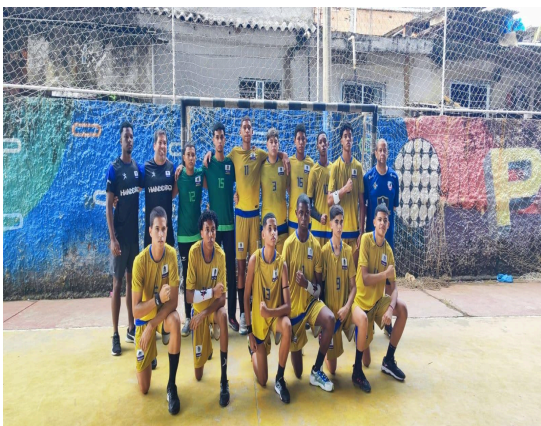
Mesquita SEMCELT B