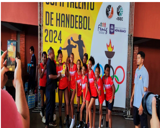
CAMPEÃO - NIHC