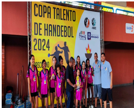
VICE-CAMPEÃO - CEAS