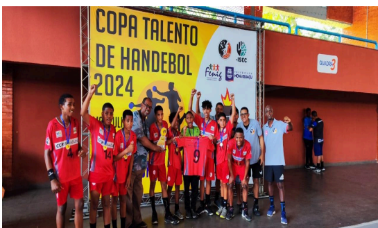
CAMPEÃO - CEAS