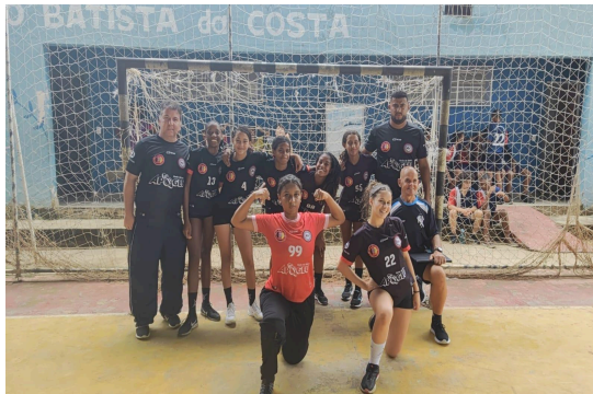
CHAC NOVA IGUAÇU