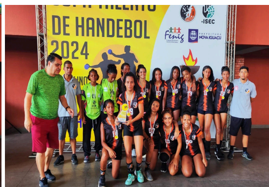
VICE-CAMPEÃO - CHAC/NIHC