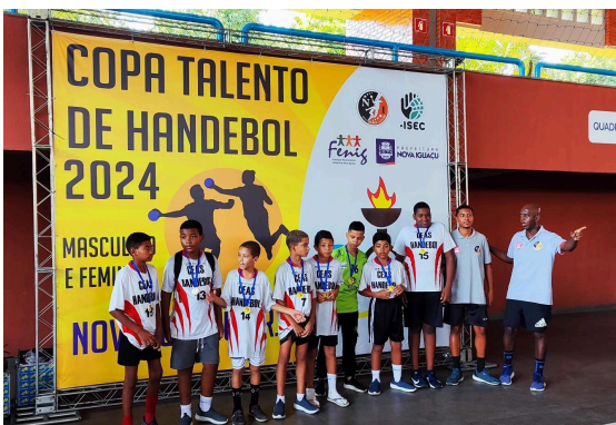
CAMPEÃO - CEAS